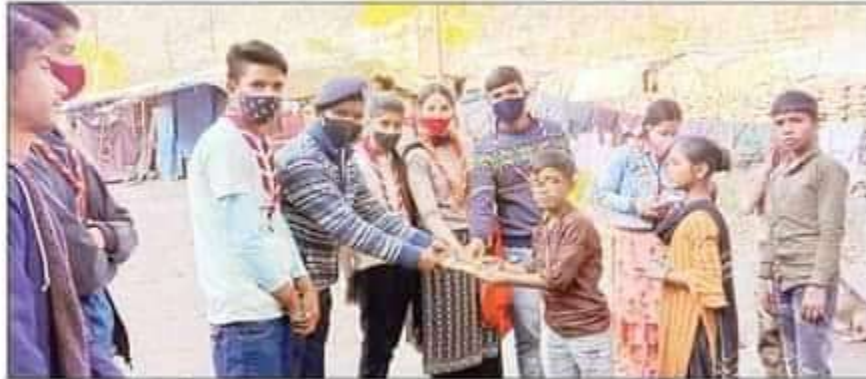
कुल्लू : बच्चों को कापियां व पैन वितरित करते हुए रोवर एवं रेंजर।

MON, 08 NOVEMBER 2021 EDITION: KULLU KESARI, PAGE NO. 2