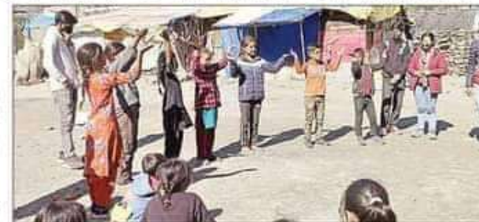
कुल्लू : रोवर रेंजर यूनिट के सदस्य झुग्गी-झोंपड़ियों के बच्चों को खेल गतिविधि कराते हुए।