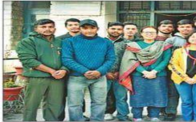
कुल्लू से कर्नाटक के लिए

बता दें कि कुल्लू महाविद्यालय के रोवर-रेंजर पहली बार अंतरराष्ट्रीय स्तर की सांस्कृतिक जंबूरी में भाग लेंगे। इसके लिए महाविद्यालय प्रबंधन ने तैयारियां शुरू कर दी हैं। गौर रहे कि स्काउट गाइड की अंतरराष्ट्रीय सांस्कृतिक जंबूरी का 21 से 27 दिसंबर तक कर्नाटक में आयोजन किया जाएगा।