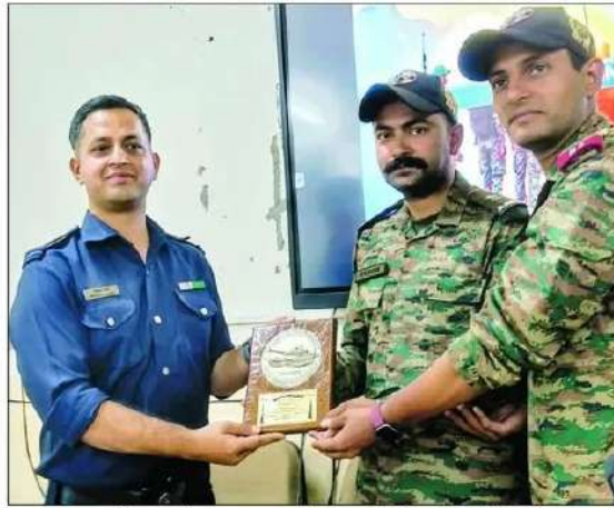
राजकीय महाविद्यालय कुल्लू में बुधवार को 84 आर्म्ड रेजिमेंट की टीम को सम्मानित करते एनसीसी के अधिकारी।