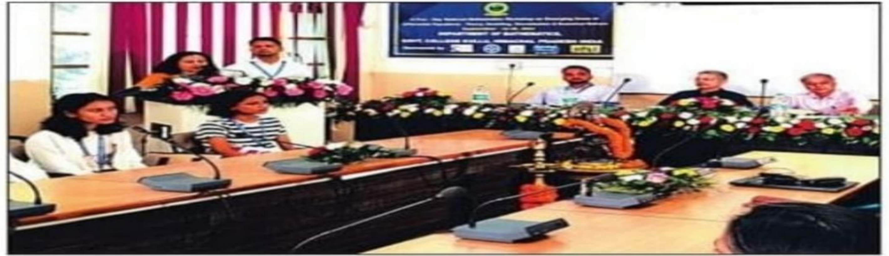
कुल्लू महाविद्यालय में चल रही गणित कार्यशाला। - संवाद